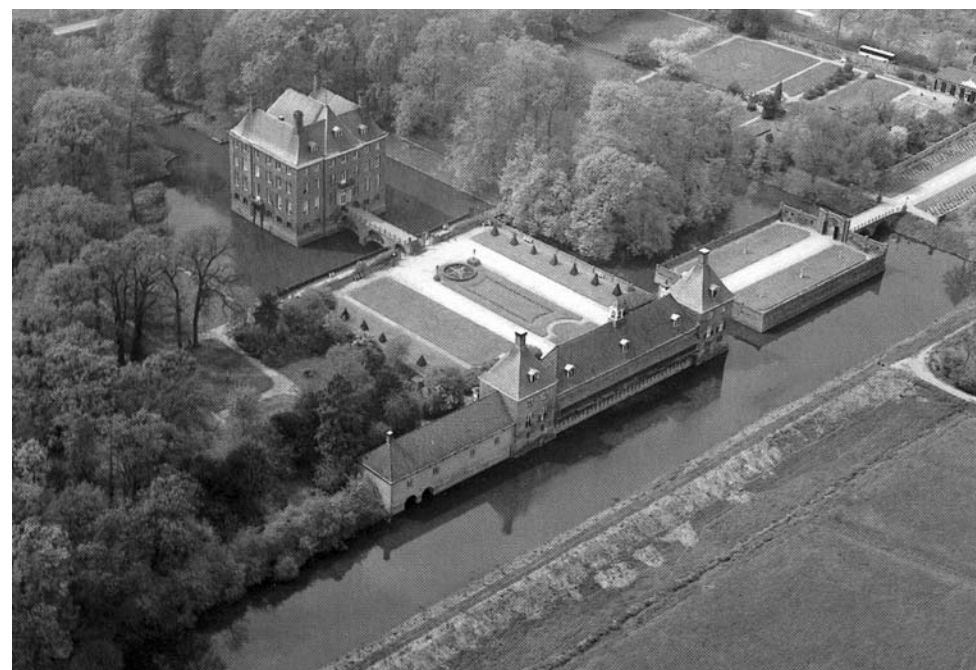
De voormalige kaatsbaan te Amerongen (onderaan, bij het water), die is omgebouwd tot koetshuis

De meest recente van de drie overgebleven kaatsbaangebouwen staat bij het Kasteel Amerongen. Een vogelvluchtkaart van het kasteel uit omstreeks 1700 laat een