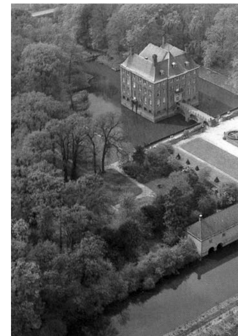
De voormalige kaatsbaan te Amerongen (onveranderd) die is omgebouwd tot koetshuis