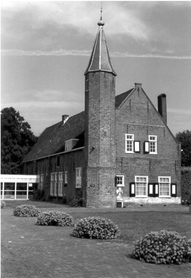
De voormalige kaatsbaan te Haarlem in zijn huidige vorm.