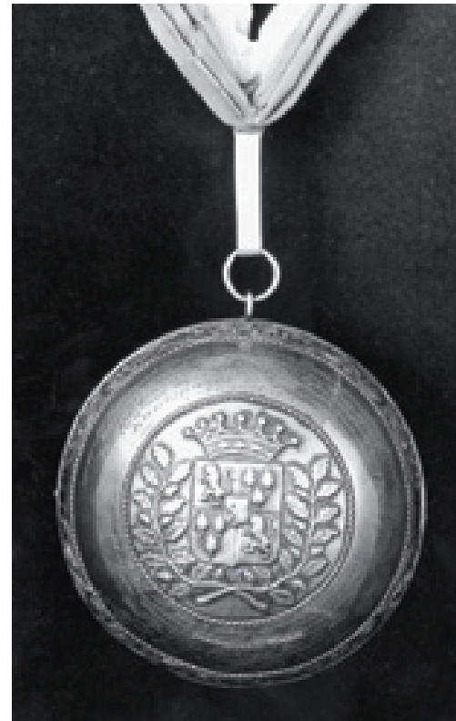
De achterkant fan de PC-bal, mei it wapen fan de kommissaris.]

Op 't Sté fen 't âlde Sjaerdema Hat Fryslâns Haed van Harinxma