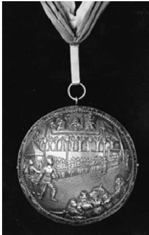
De foarkant fan de PC-bal.