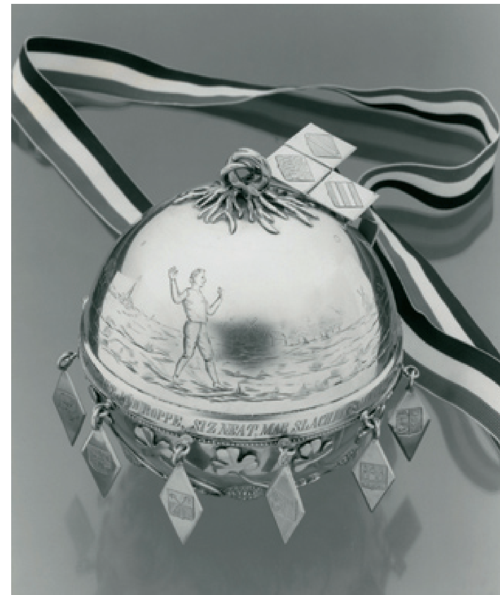
De Mulierbal, mei wapens.

'Toen Peke Toek in het vorig no. van dit blad eenige aanmerkingen maakte op het versje dat op den zil- veren bal werd geplaatst, welke aanmerkingen zeker niet ongegrond zijn, en toen hij daarbij de vraag