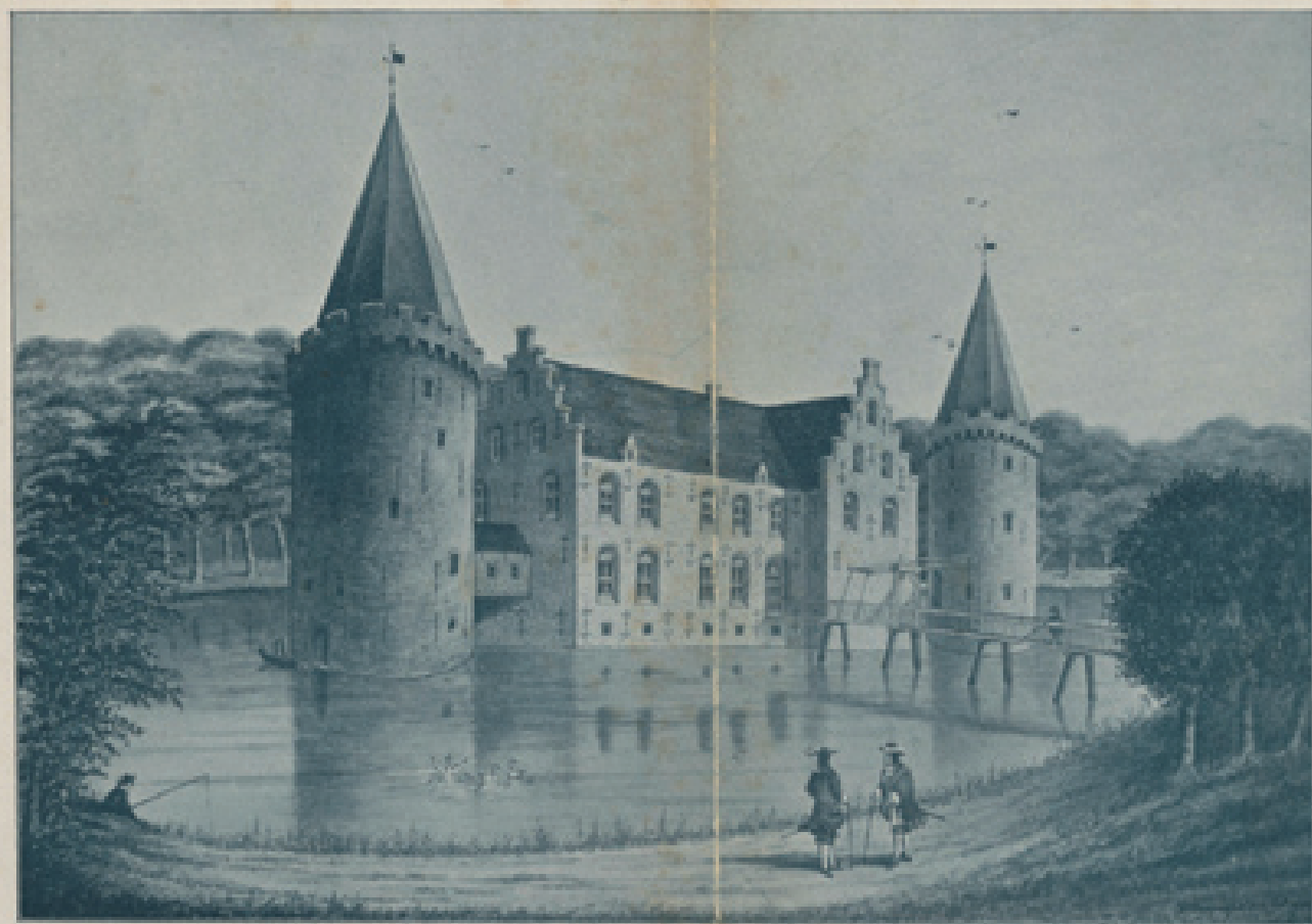
SJAERDEMA-SLOT TE FRANEKER.