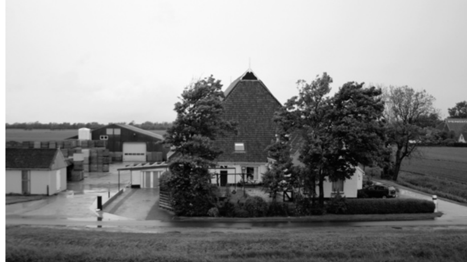
Swingmastate ûnder Winaam.

fan allegear wûn, ûnder mear ek twa kear de P.C. (1873, 1875 en de preemje yn 1869 en 1874). Yn wikseljende partoeren keatsten dizze Hiddinga's faak mei Rients Koopmans (1847-1929, de lettere P.C.-foarsitter; fan memmekant in Hiddinga) en mei de bruorren Piter en Dirk Ynzdes de Boer út Winaam. Koopmans hat trije kear de P.C. wûn: yn 1873, 1875 en 1876. Doe't er 75 jier waard, stie der yn de Franeker Courant in stikje: 'De heer Koopmans toch is uit vroeger dagen een der beste Friesche spelers. Zijn kracht was de opslag. In het oude dorp Wijncaldum