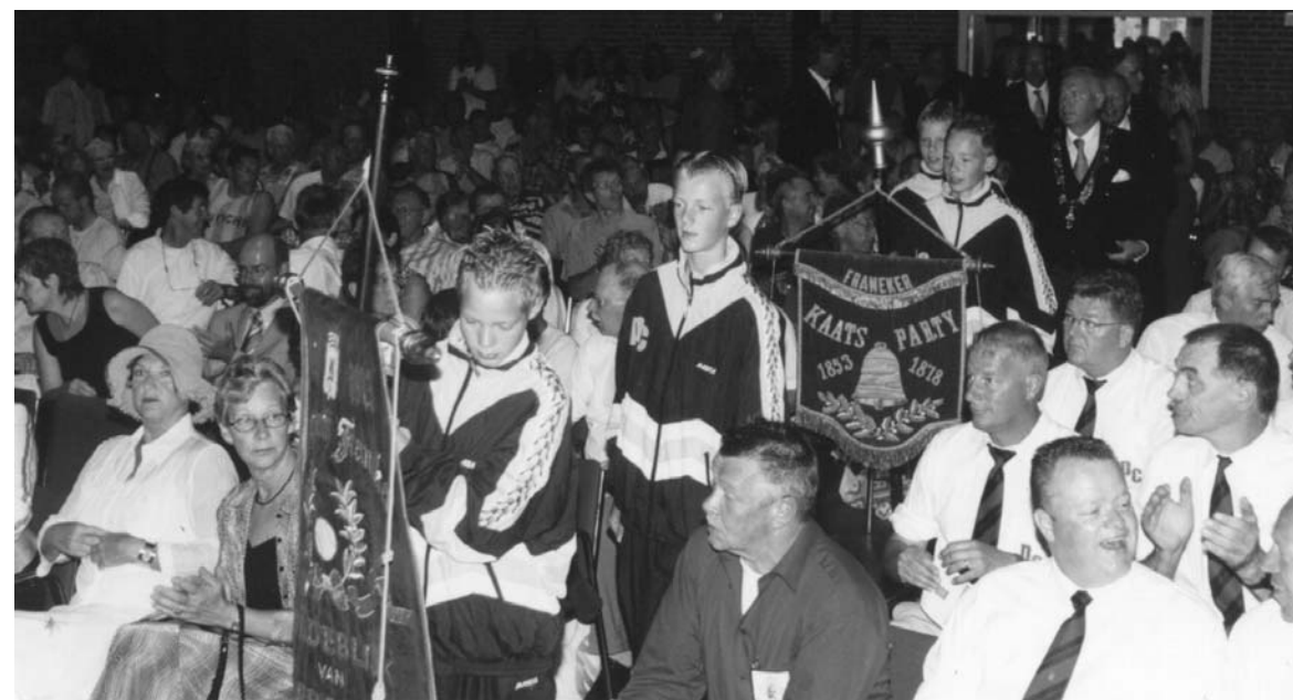
Binnenkomst van het PC-bestuur in de Koornbeurs in 2004.

Opeens werd het publiek stil. Met ongeduld werd gewacht op de traditionele openingspeech van de voorzitter van de PC. Die begon stipt om acht uur. Geen minuut eerder, geen minuut later. De voorzitter, een oudere man, had een natuurlijke uitstraling en sprak op een spontane en gemakkelijke manier. Zoals ik heb begrepen van mijn vertaler, verwerkte hij in zijn toespraak grappige gebeurtenissen (anekdotes) uit het verleden. Ik keek ondertussen rond om de spanning op de gezichten van de aanwezigen te kunnen zien. Ze leken niet gespannen, luisterden geïnteresseerd, aandachtig en enigszins trots. Zelfs mijn gastheer vergat mij de toespraak te vertalen, uitgezonderd een