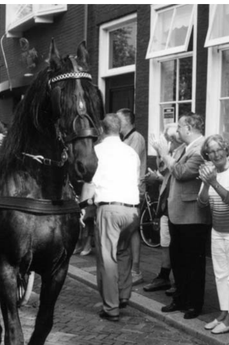
- bij de Koornbeurs met daarin 2003.

te uit Roemenië, was in 2004 zoek haar herinneringen aan die