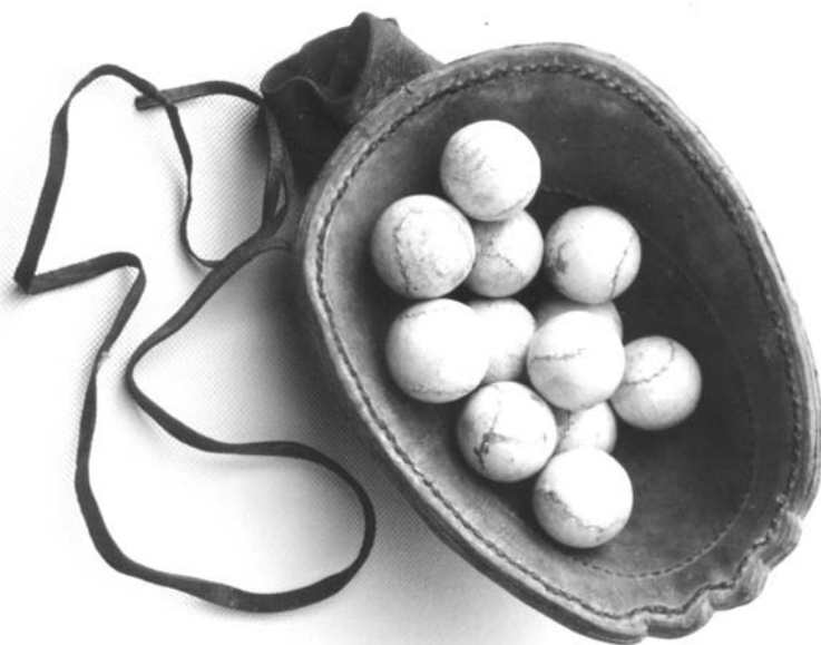
'Kimswerter' tamisballen en -want.

yn augustus 1887 gong it oan: doe ûndernemen Bogtstra en twa oare PC-leden de reis nei Brussel. 2