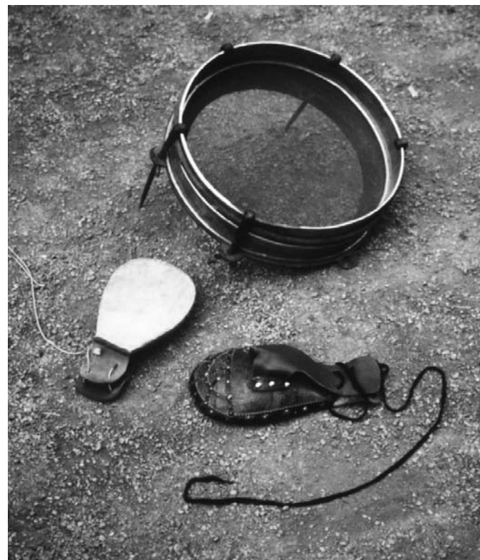
Platte wanten en tamis brûkt op de demonstraasjewedstriid fan 15 septimber 1992 te Corbie (Fr.).