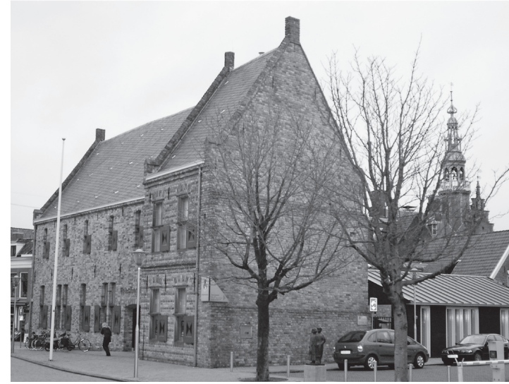
It Keatsmuseum is ûnderbrocht op de boppeferdjippingen fan de Friesland Bank te Frjentsjer.