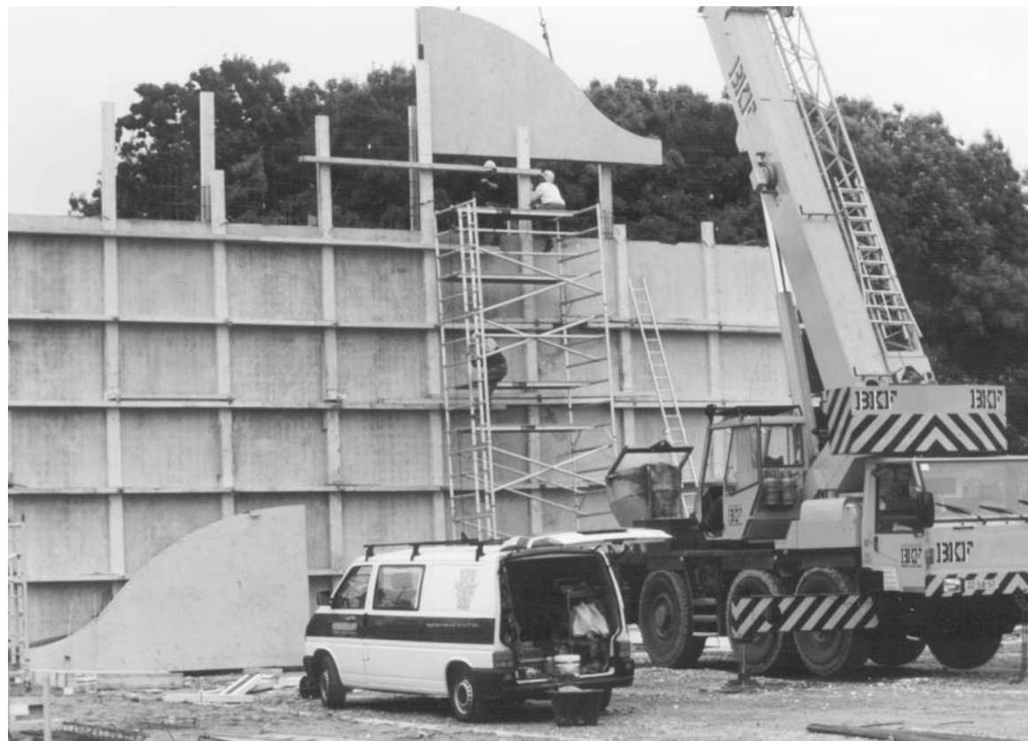
De Keatsmuorre by Blomketerp yn oanbou.

kwaliteit fan de keatsers dy't op it heechste nivo keatse, is boppedat te ûngelyk om fan topsport prate te kinnen. De progressy is alsa marginaal.