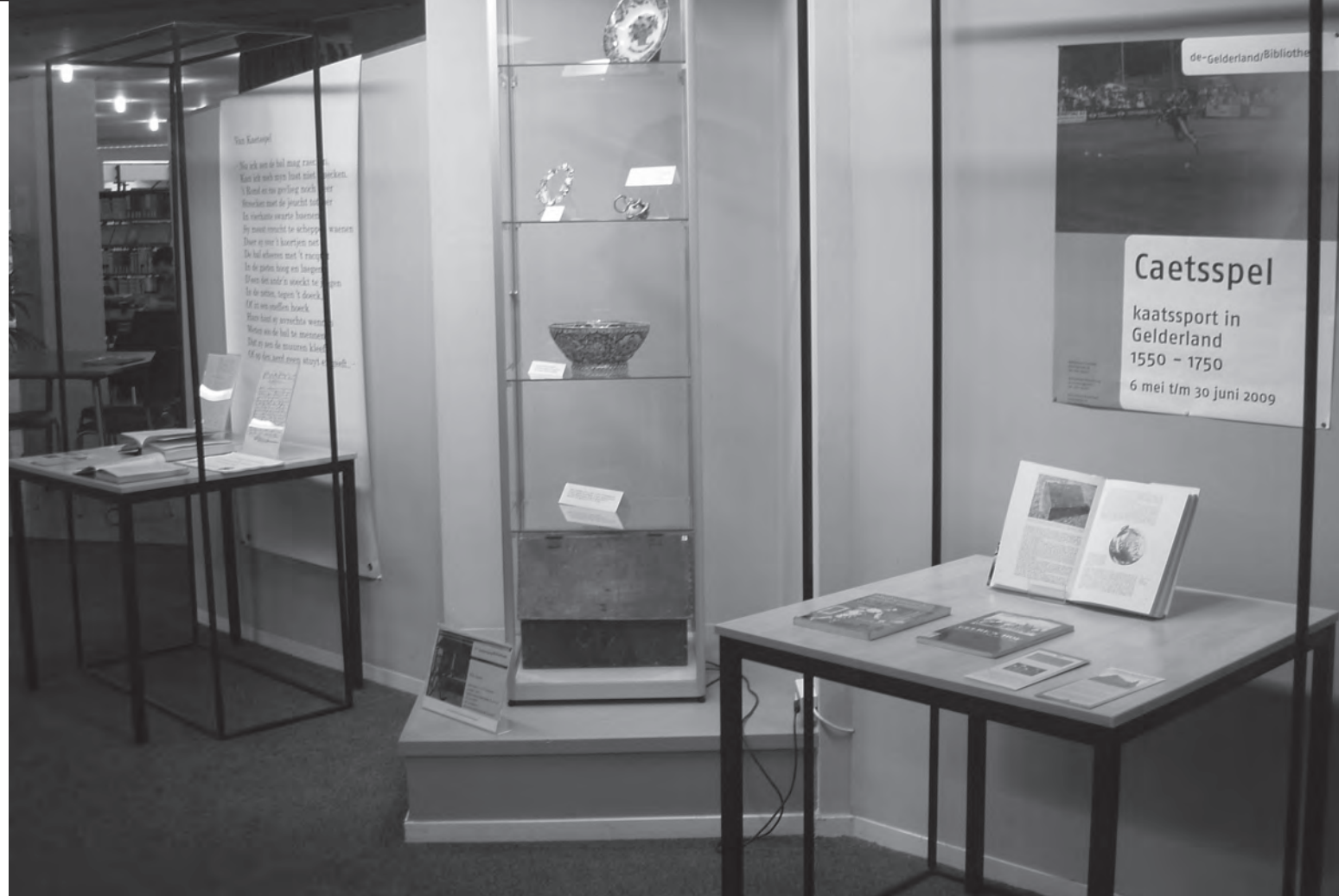
Aanblik op de tentoonstelling in de Gelderland Bibliotheek.

staat van Filips de Schone, die in 1506 na het kaatsen kou vatte en overleed en de Colloquia van Erasmus, waarin hij over het kaatsen schreef (1520). Natuurlijk kwamen de (moderne) kaatsregels erbij te liggen, met een plattegrond van het kaatsveld.