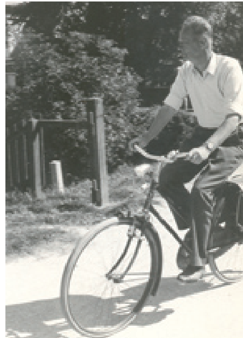
Underweis nei in keatspartij?